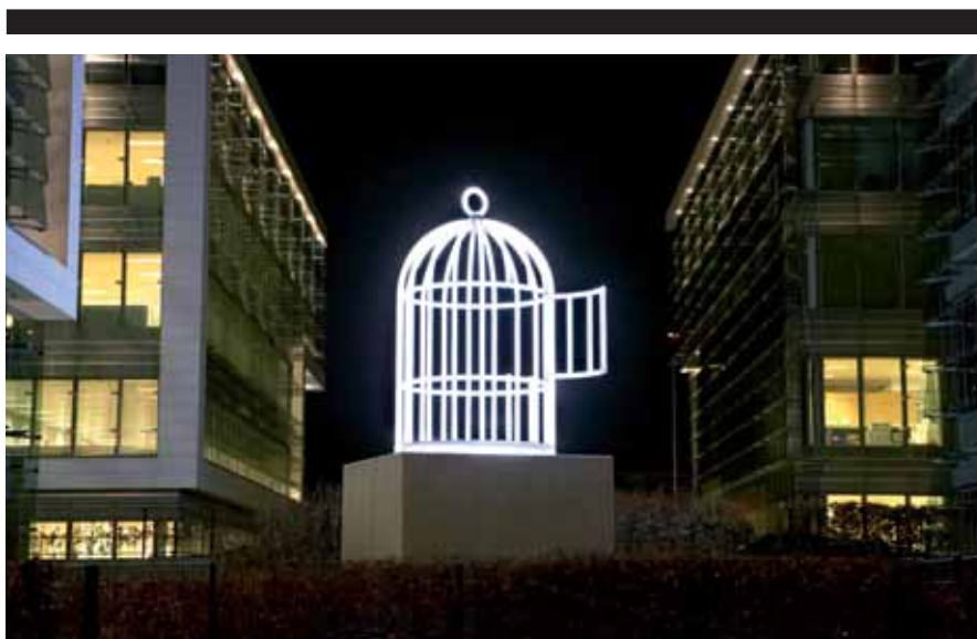
BIRD CAGE, 2008, TSE/MAJERUS.